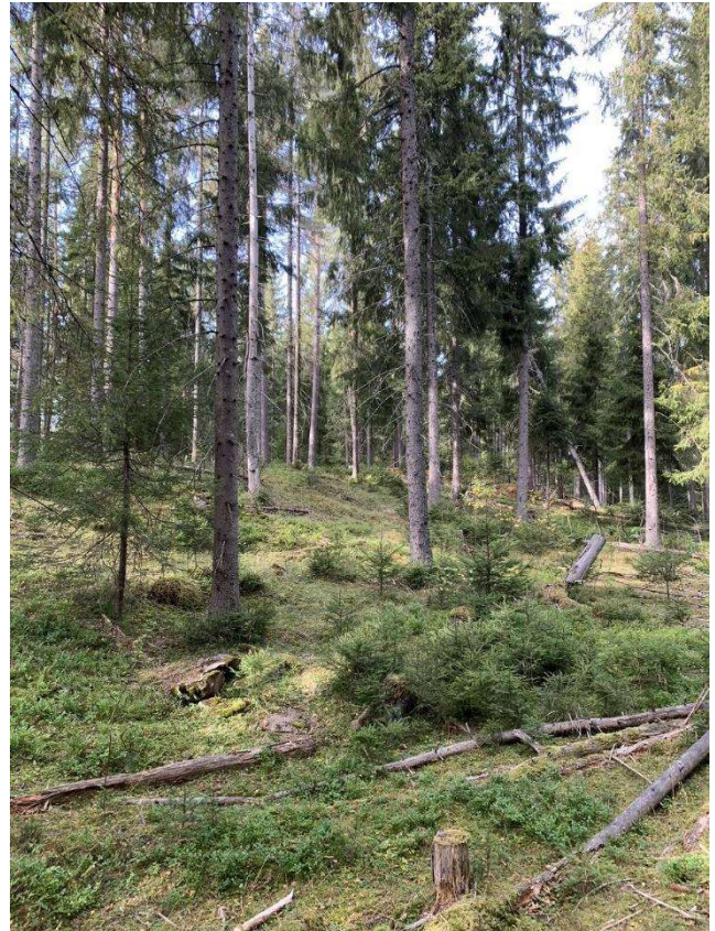
Naturlig foryngelse i skog preget av lukket hogst.

Veilederen er utarbeidet i felleskap partnerne imellom, der de enkelte partene hadde ansvar for innspill til forskjellige deler av veilederen. Hovedbidragsytere har vært prosjektleder og Norskog, med viktige bidrag fra NSF og Sabima. Mot slutten har andre fra både NSF og Skogkurs bidratt. Mathis