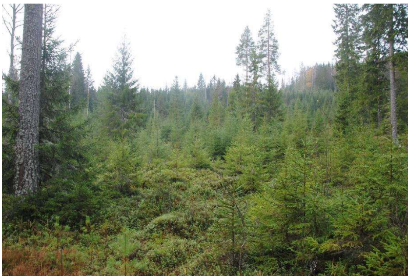
Skjermstilling med god foryngelse.

Det ble gjennomført filming av lukkede hogster, både praktisk gjennomføring og typisk skogbilde etter forskjellige typer lukkede hogster. Arbeidet med redigering er ikke ferdigstilt, og dette materialet vil presenteres på et senere tidspunkt. Årsakene til dette er blant annet restriksjoner på aktivitet grunnet pandemien de siste to årene som var kompliserende for dette arbeidet både ute i skogen og her hos Skogkurs.